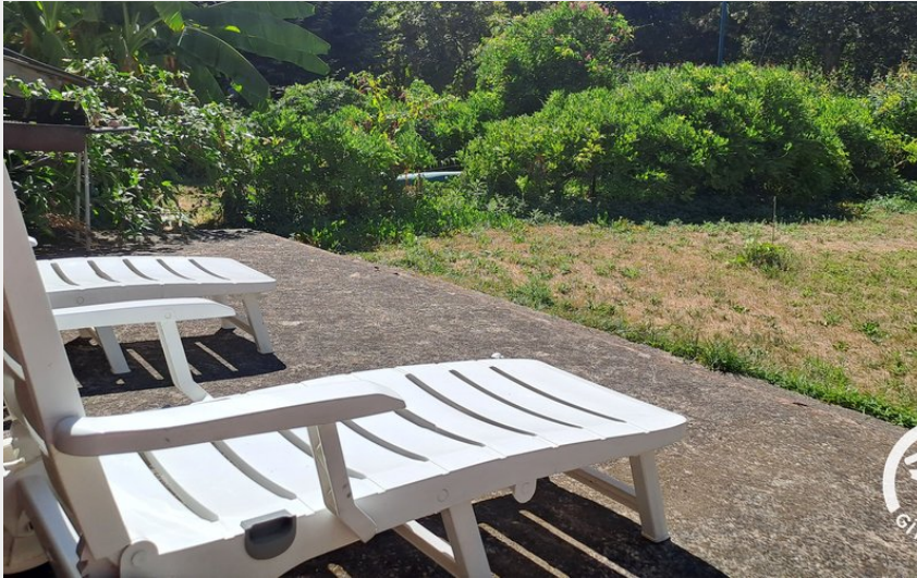
Crédit photo : La Presqu'île d'Ambialet - G669 - Ambialet (ATTER - Gîtes de France Tarn)