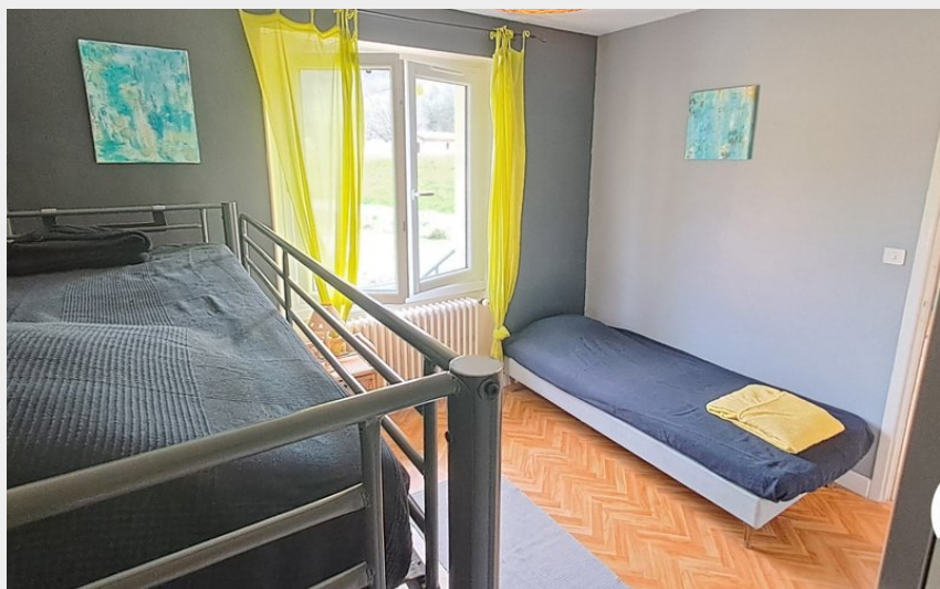
Crédit photo : Chambre enfants (ATTER Gîtes de France ©AlvesClaire)