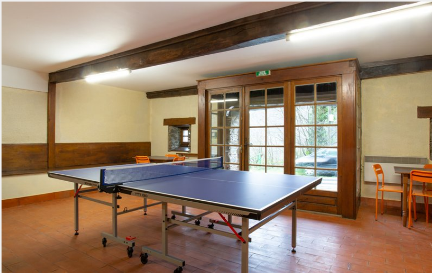
Crédit photo : G1765 - La Moulinquié - Saint-Cirgue (ATTER Gîtes de France Tarn)