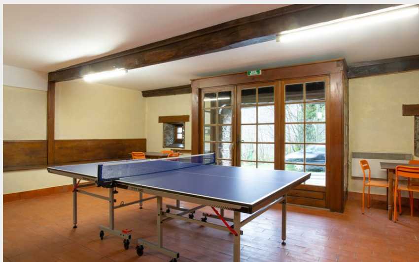
Crédit photo : G1765 - La Moulinquié - Saint-Cirgue (ATTER Gîtes de France Tarn)