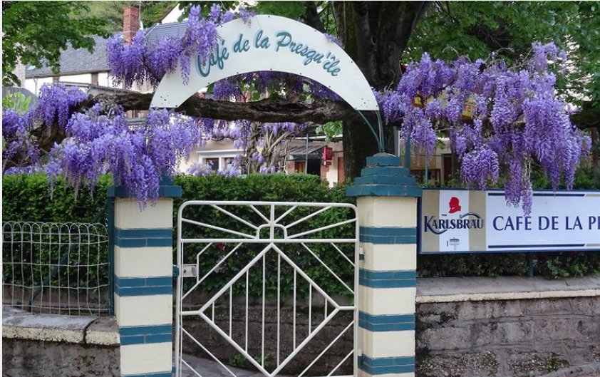
Crédit photo : Façade Café de la Presqu'île Ambialet (Café de la Presqu'île)