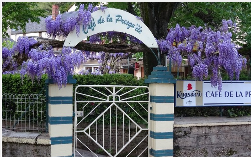
Façade Café de la Presqu'île Ambialet