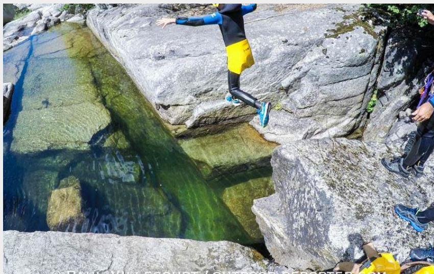
Crédit photo : Canyoning Famille - Joli petit saut (Bureau des Moniteurs Sainte Enemie)