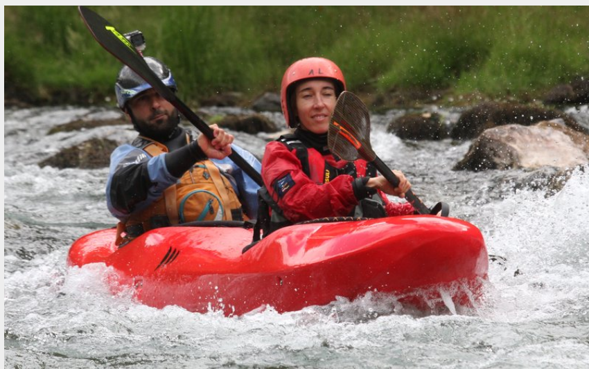
Crédit photo : Kayak duo Gorges du Tarn Guidée (B&ABA Sport Nature)