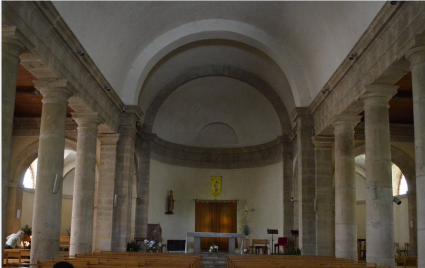
Eglise de Florac