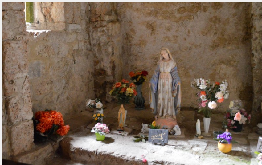
Chapelle Notre-Dame de Cénaret