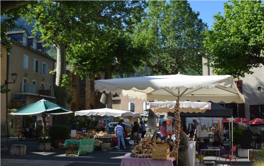
Village d'Ispagnac