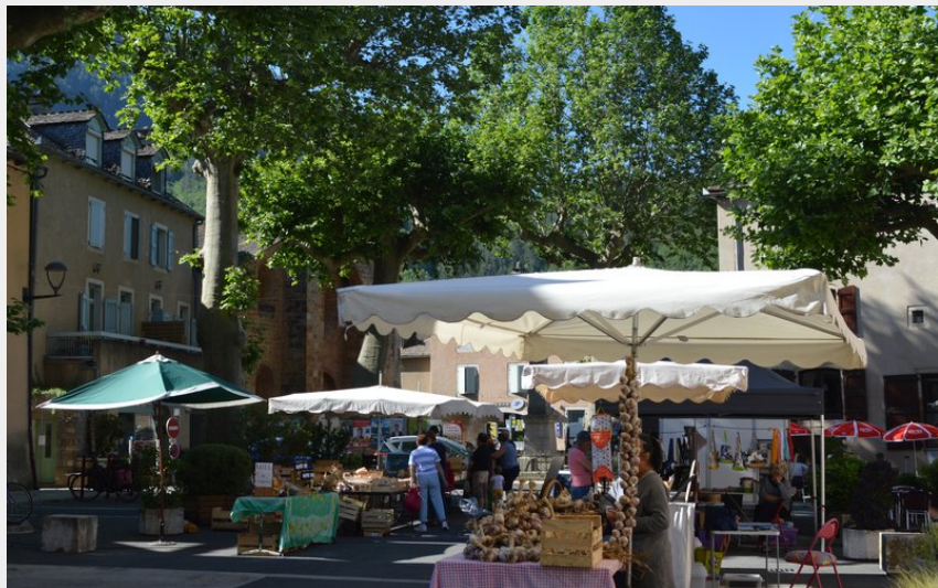
Village d'Ispagnac