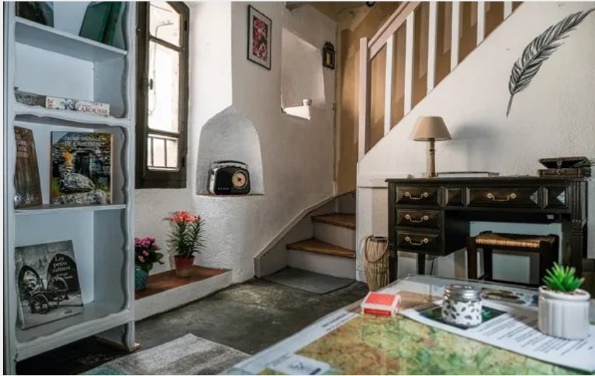
Crédit photo : Petit salon pour vous détendre (Meublé Vanessa André)