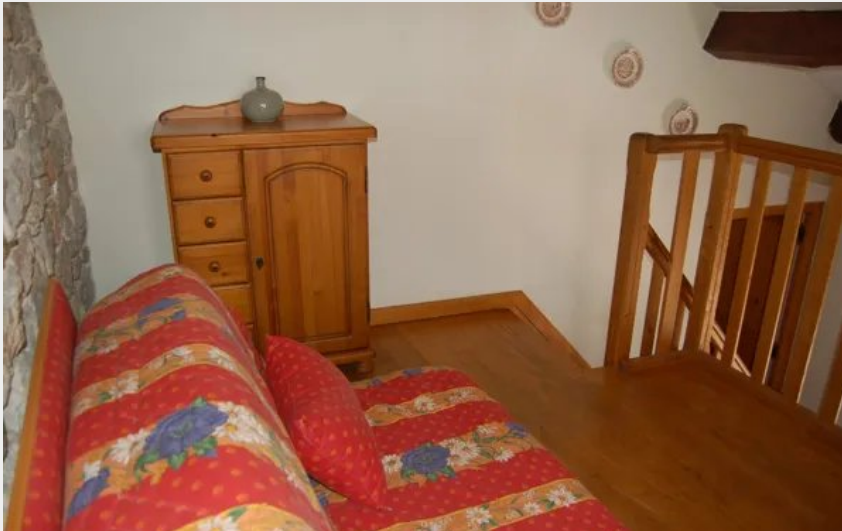
Mezzanine avec BZ du gîte Lou Clapas