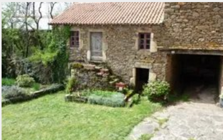
Crédit photo : Gîte rural - AYG8025 (Comité Départemental du Tourisme de l'Aveyron)