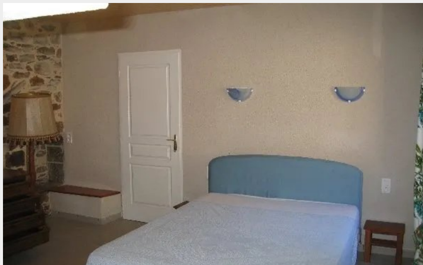
Grande chambre de caractère