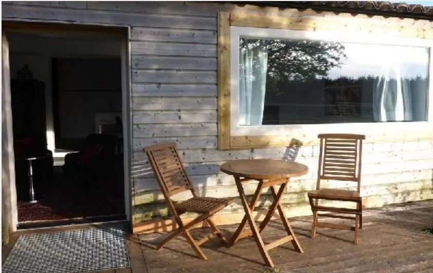
Crédit photo : Les Mourguettes (OFFICE DE TOURISME LARZAC TEMPLIER CAUSSES ET VALLEES)