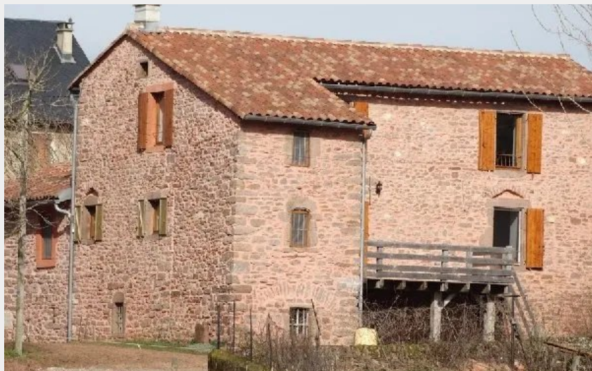
Crédit photo : Le Mas de Jean (OFFICE DE TOURISME DU ROUGIER DE CAMARES)