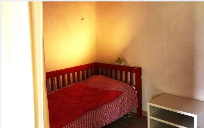
Espace couchage lit 90 (gigogne)