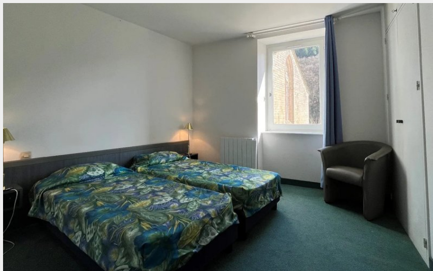
Crédit photo : Chambre 2 lits séparés avec vue sur le parvis de l'abbaye (Maison de Blanche)