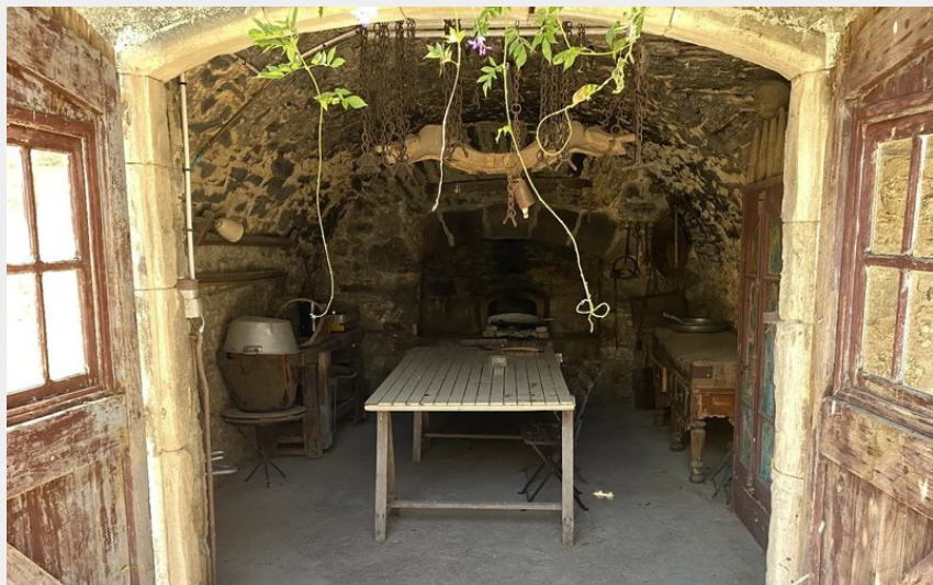
Crédit photo : Domaine de Linars - La Forge (Château de Linars - L'aile du château)