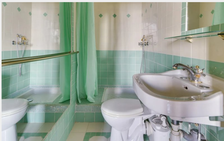
Crédit photo : Château de Linars - 1er étage (Château de Linars - L'aile du château)