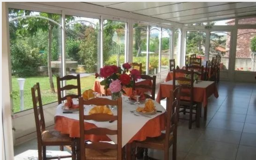
Crédit photo : Le Clos Normand (OFFICE DE TOURISME DU ROUGIER DE CAMARES)