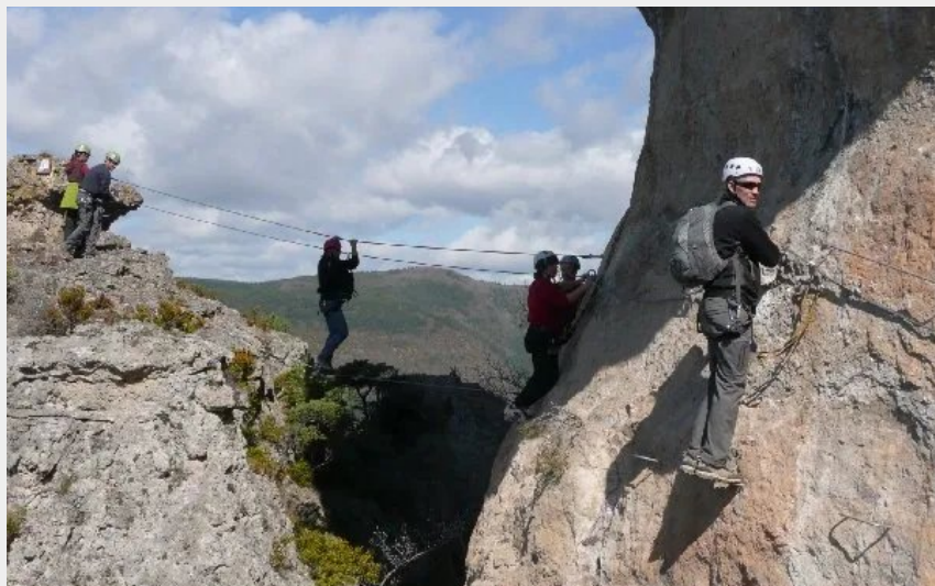
Via Ferrata de Liaucous - Entrée des Gorges du Tarn