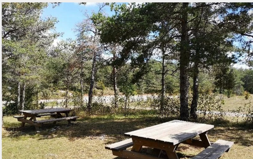
Aire de pique-nique de Roquesaltes