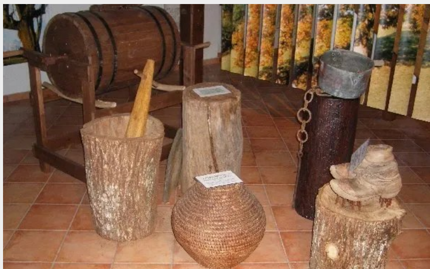
Crédit photo : Outils utiles à la transformation des châtaignes (Les amis du patrimoine ayssenois)