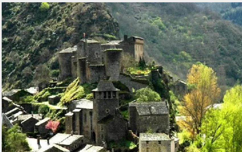
Crédit photo : CHATEAU DE BROUSSE - CÔTÉ OUEST (ALAIN DRUILHE CARRÈRE)