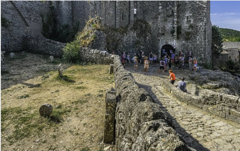
Crédit photo : Château Templier de la Couvertoirade (OFFICE DE TOURISME LARZAC VALLEES)