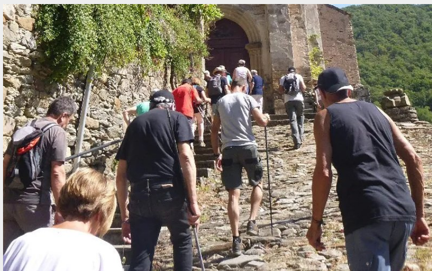
Crédit photo : Découvrir le village de Lincou (OFFICE DE TOURISME DU REQUISTANAIS)