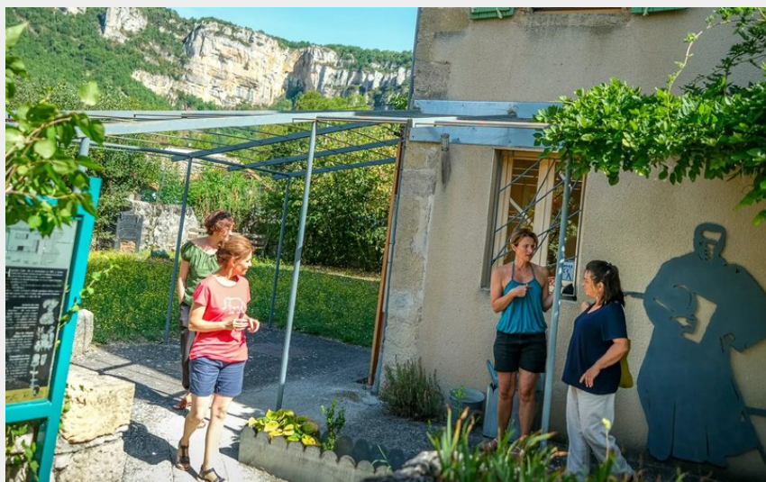
Crédit photo : L'Espace botanique Hippolyte Coste (OFFICE DE TOURISME LARZAC VALLEES)