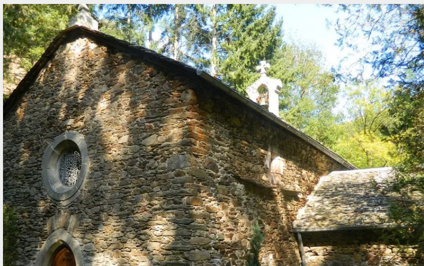
Crédit photo : Chapelle St-Cyrice et Sentier d'interprétation (Mairie du Truel)