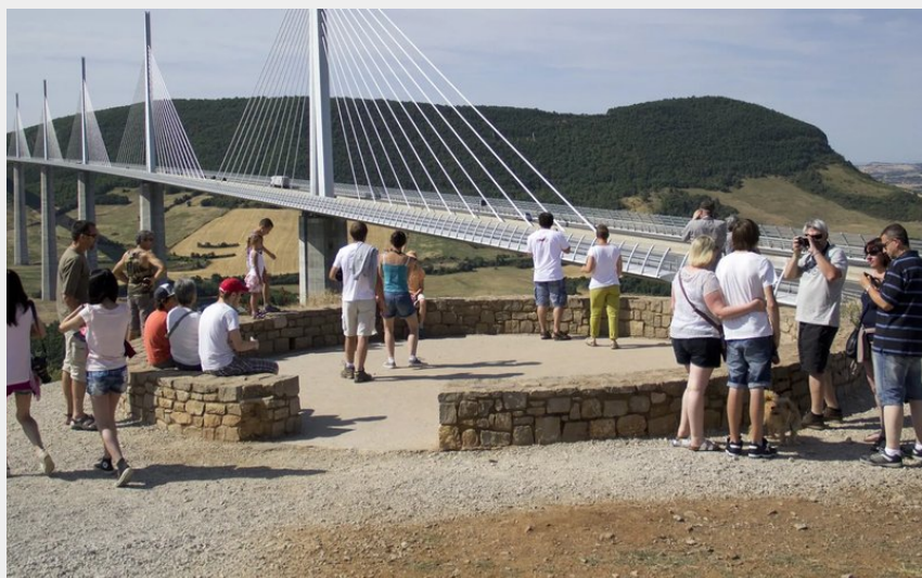
Crédit photo : Belvédère - Aire du Viaduc de Millau (Espace Tourisme)