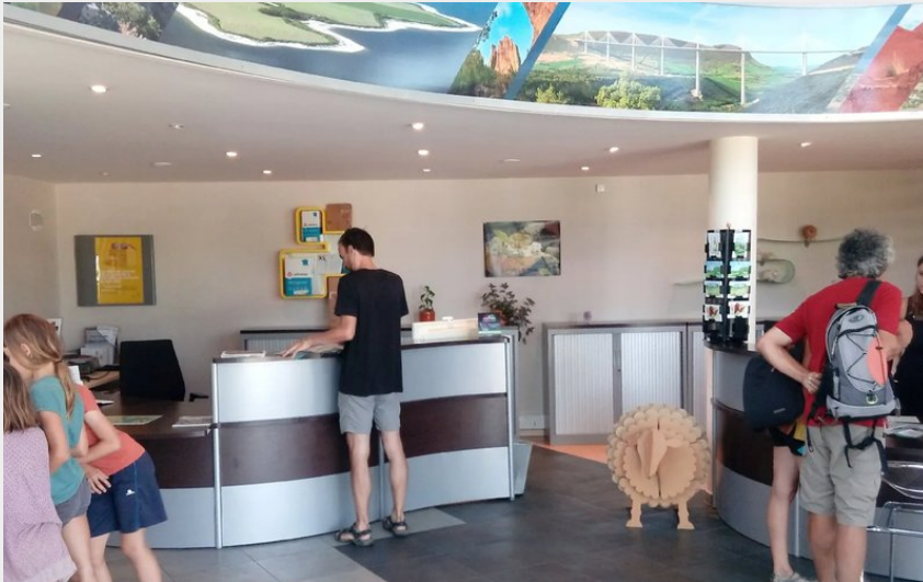
Crédit photo : Office de Tourisme Pays du Roquefort. Espace accueil (ROQUEFORT TOURISME)