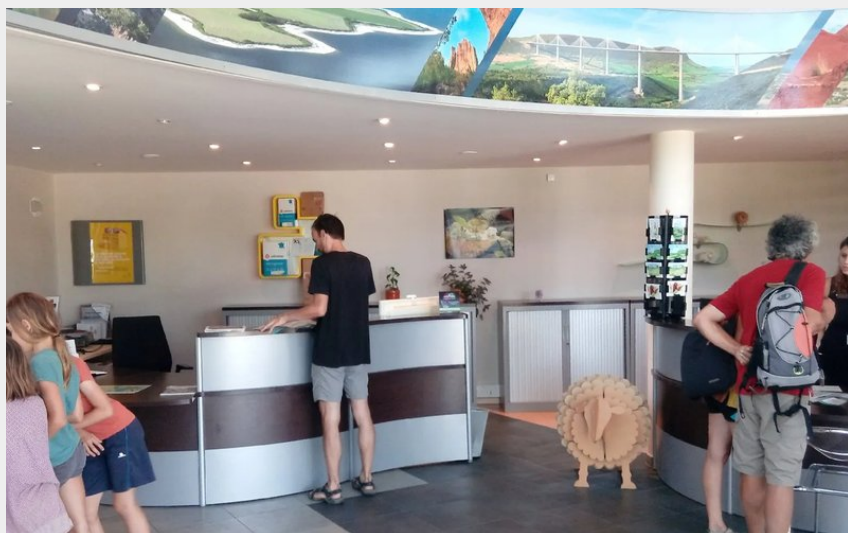
Crédit photo : Office de Tourisme Pays du Roquefort. Espace accueil (ROQUEFORT TOURISME)