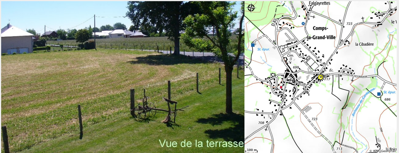
Crédit photo : Mme Guitard à Comps - vue de la terrasse (Mme Guitard à Comps)