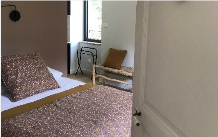
Crédit photo : "La Maison de Tonton" (OFFICE DE TOURISME DE PARELOUP LEVEZOU)