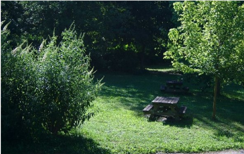
Crédit photo : Camping municipal de la Muse (SYNDICAT D'INITIATIVE DES RASPES DU TARN)