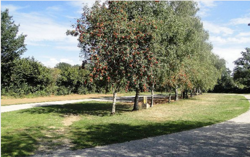
Crédit photo : Aire de camping car municipale (OFFICE DE TOURISME DE PARELOUP LEVEZOU)