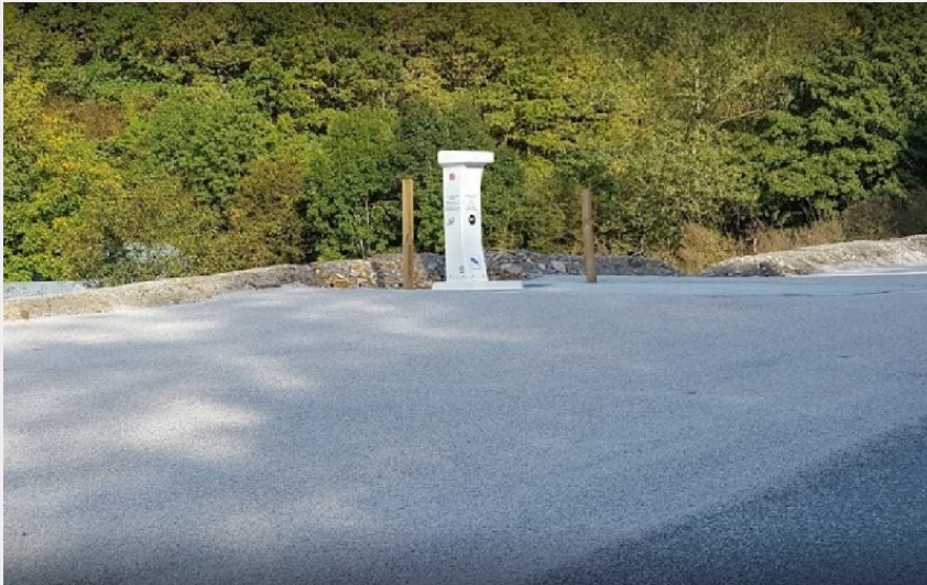
Crédit photo : Aire de camping-car municipale de Cénomes (Office de Tourisme Rougier d'Aveyron Sud)