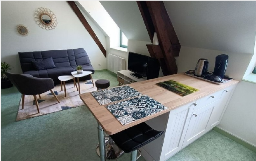
Crédit photo : Appartement des lacs (OFFICE DE TOURISME DE PARELOUP LEVEZOU)