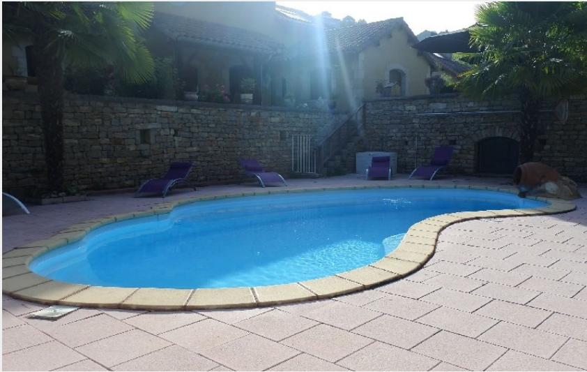
Crédit photo : Piscine - Camping Le Randonneur (Camping Le Randonneur)