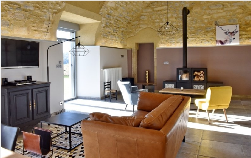
Crédit photo : Castel D'Alzac - Gîtes au Château - "Le Jardin du Château"