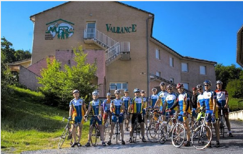
Crédit photo : Groupe d'adultes (Centre de séjours Relais Valrance)