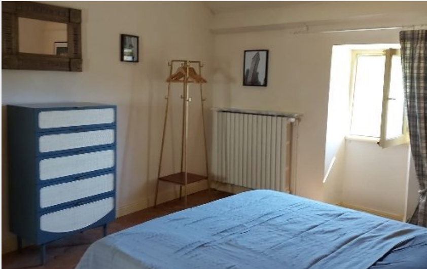
Crédit photo : Chambre d'Hôtes Serpin Nicolas (Chambre d'hôtes Serpin Nicolas)