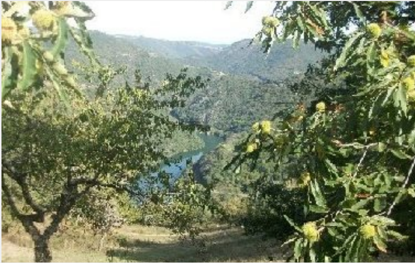
Crédit photo : Vue sur les Rasperes du Tarn du fond du jardin (Claudine FABRE)