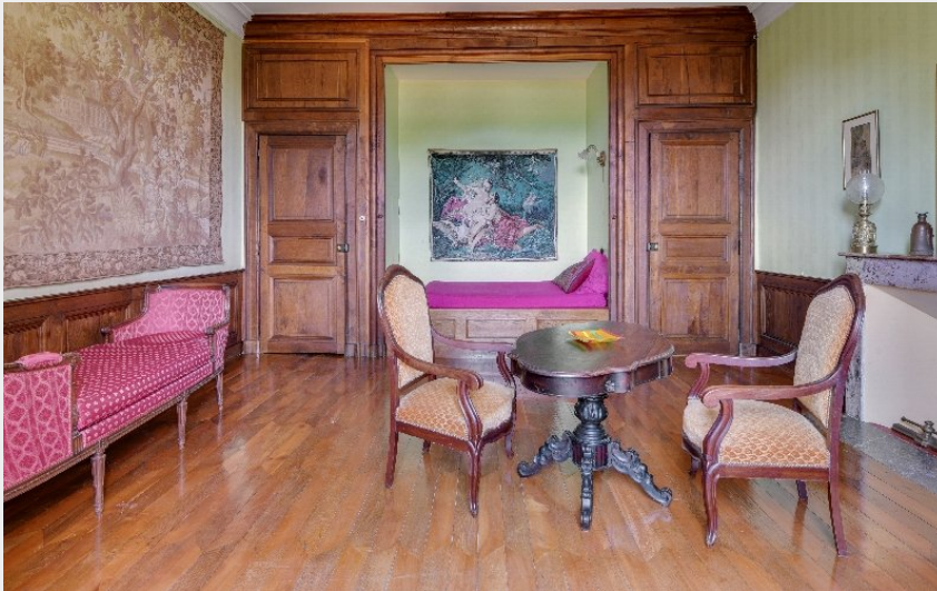
Crédit photo : Château de Linars - 1er étage (Château de Linars - L'aile du château)