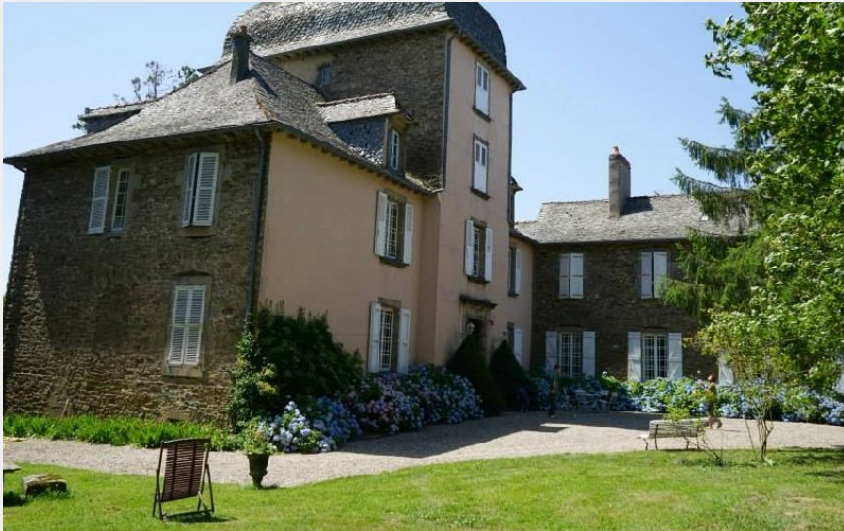
Crédit photo : Château de Linars - L'aile du château (Château de Linars - L'aile du château)