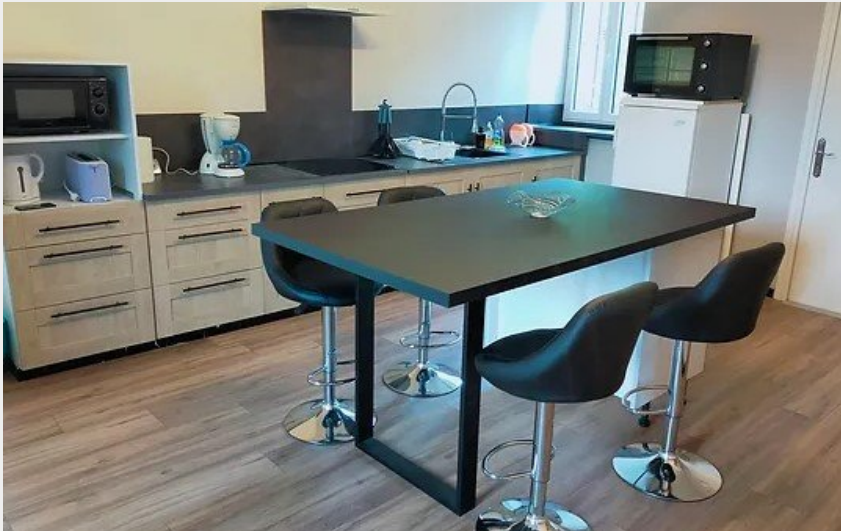
Crédit photo : Cuisine Gite La Chaussée d'Orient ( Gite La Chaussée d'Orient)