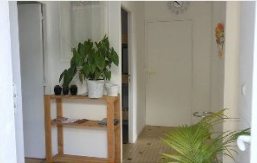
Crédit photo : Monique MONTANER entrée (OFFICE DE TOURISME DE PARELOUP LEVEZOU)