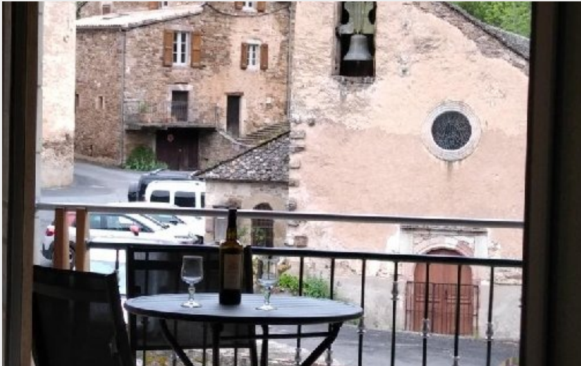
Crédit photo : Gîte d'Orzals (OFFICE TOURISME DU PAYS DE LA MUSE ET RASES DU TARN)